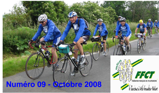
Numéro 09 - Octobre 2008