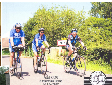
ALENÇON 3 Sommets Cyclo 10 juin 2007