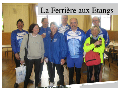
La Ferrière aux Etangs

Il est des clubs qui ont la bougeotte, mus par le désir de la découverte, l'envie de nouveaux paysages, des cyclos que rien ne rebute, ni les difficultés de la route, ni la distance, ni le temps. Pour ce qui est de ce dernier point, il faut dire qu'ils ont été servis ; trop contents d'un début d'année sympa, et d'un mois d'avril où il fut bien agréable de se découvrir de plus d'un fil, les mois de mai et juin les ont rattrapés. Que croyez-vous qu'il arriva ? Ils roulèrent quand même ! Moralité, on vit des maillots bleus partout, et pas seulement en Normandie.