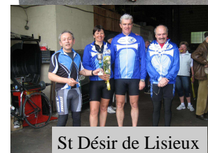
St Désir de Lisieux

S'il est des randonnées qui vous laissent de bons souvenirs et elles sont nombreuses, il en est d'autres qui, au contraire, ne vous donnent guère envie d'y retourner. Pour ce qui me concerne, je n'irai pas goûter une seconde fois à