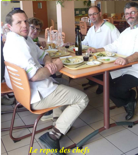
Le repos des chefs