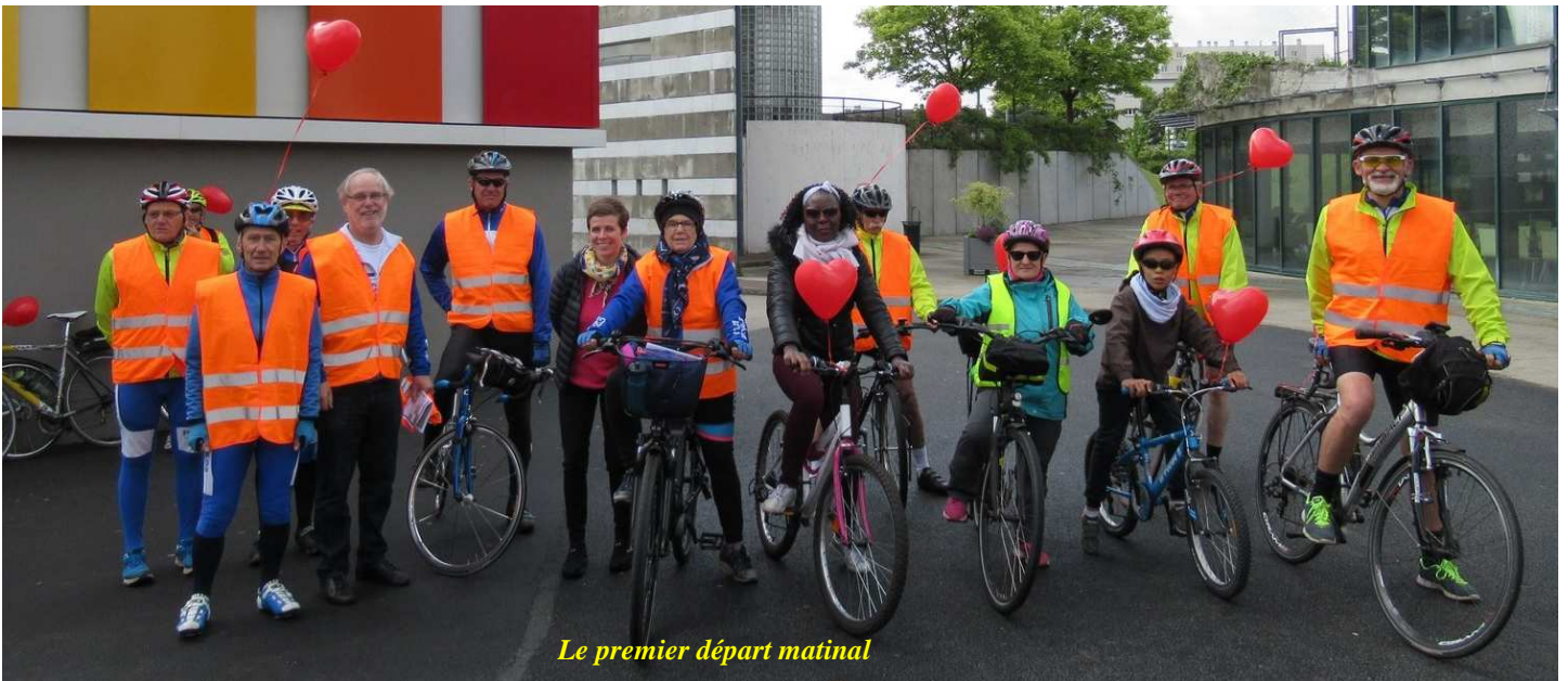
Le premier départ matinal