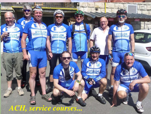
ACH, service courses...