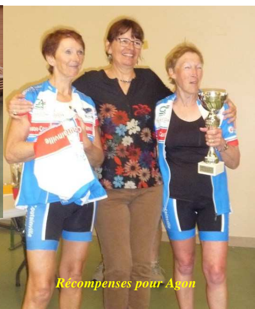
Récompenses pour Agon