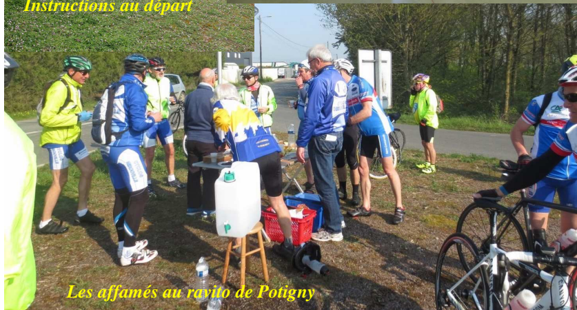
Les affamés au ravito de Potigny