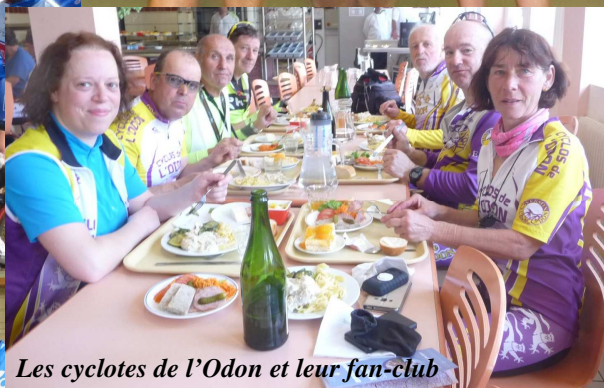
Les cyclotes de l'Odon et leur fan-club