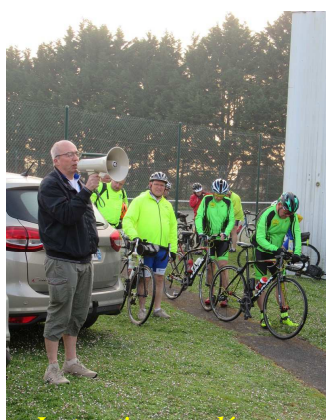
Instructions au départ