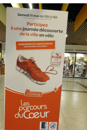
Pub dans le hall du Centre

Près de 700 Petit Lourdes existent mais celui d'Hérouville est le seul au monde à être quasi-conforme à l'original ! Comme Lourdes, une véritable source se trouve dans la grotte. Par an, ce sont près de 12.000 pèlerins et visiteurs de tous les horizons qui viennent se recueillir au Petit-Lourdes d'Hérouville.