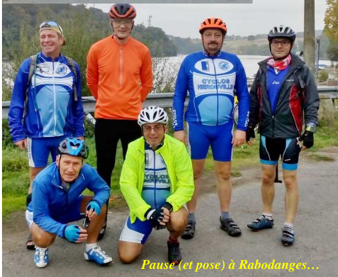
Pause (et pose) à Rabodanges...

leurs, les senteurs, quasiment pas de voitures sur ces petites routes verdoyantes, la bonne humeur et le vent de 3/4 arrière en guise de cerise sur le gâteau.