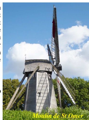
Moulin de St Omer