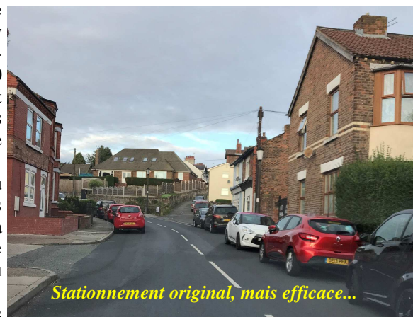
Stationnement original, mais efficace...