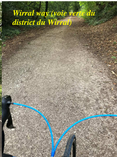
Wirral way (voie verte du district du Wirral)

temps, lorsque j'allais lui rendre visite, j'apportais mon vélo. Mais j'étais limité par les cartes routières, plutôt différentes des nôtres et surtout bien embêté par les routes aux alentours de la maison de ma fille, une région très urbanisée (cf cartes). Grâce aux talents de Frédo la Bricole, j'ai pu cette année profiter d'une cartographie détaillée pour mon GPS. Et ça change la vie ! J'ai pu ainsi parcourir 260 km en 4 sorties, et même si je me suis paumé plusieurs fois, ce n'était que parce les routes anglaises, « c'est pas comme si c'était la même chose » qu'en France ! Par exemple, les départementales, ce sont souvent des routes à 4 voies. Pas vraiment adaptées pour un vélo, même solitaire. En plus, sur ces 4 voies, il n'y a pas de bande cyclable, ni même d'acotement et la vitesse limite est de 60 miles/h, soit quasi 100 km/h. Bref, vaut mieux serrer les fesses quand on les emprunte à vélo. Et le mieux reste de les éviter !