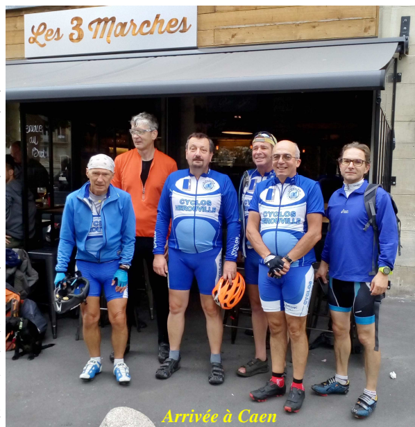
Arrivée à Caen

Jusqu'à Putanges-Pont-Ecrepin on s'est régalé, il y a le soleil, les cou-