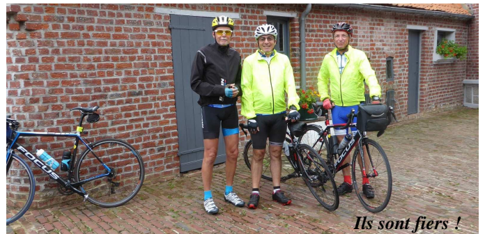
Ils sont fiers !

MAIS ! Aucun regret pour la première journée, journée « blanche » pour nos trois cyclos car nous avons découvert un site passionnant dans la commune même : La Coupole https://www.lacoupole-france.com/ où sont évoquées la seconde guerre mondiale mais plus surprenant les débuts de la conquête spatiale.