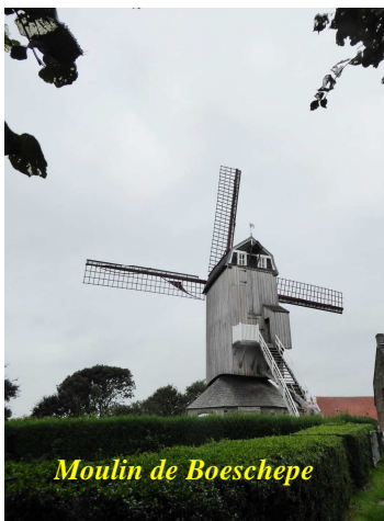
Moulin de Boeschepe

A 17 h nous avons tous rendez-vous à Ypres, grande ville drapière au Moyen Age. Le beffroi de 70 m de haut domine la halle aux draps, le plus grand bâtiment civil d'Europe, (gothique 1200-1304). La cathédrale Saint Martin complète cet ensemble magnifique et particulièrement imposant. Le temps d'une bière et nous rentrons