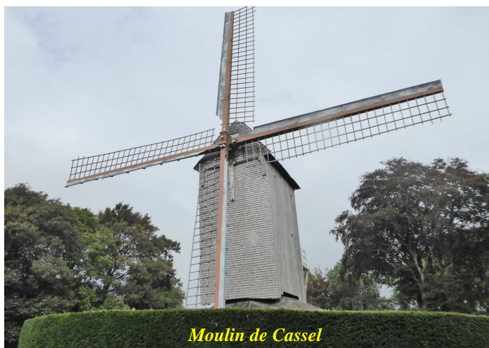
Moulin de Cassel

De leur côté, nos trois compères descendent vers Aire sur la Lys, remontent sur Hazebrouck puis Bailleul avant d'atteindre le Mont des Cats, 164m, au cœur des monts de Flandres.