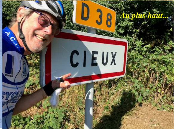
Au plus haut...