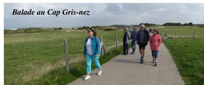
Balade au Cap Gris-Nez

Rien de tel que la montée des 200m en vélo vers le circuit du Cap gris nez pour qu'ils digèrent. Nous, la voiture nous va bien. Sur le parking visiteurs on charge les vélos, on revoit la