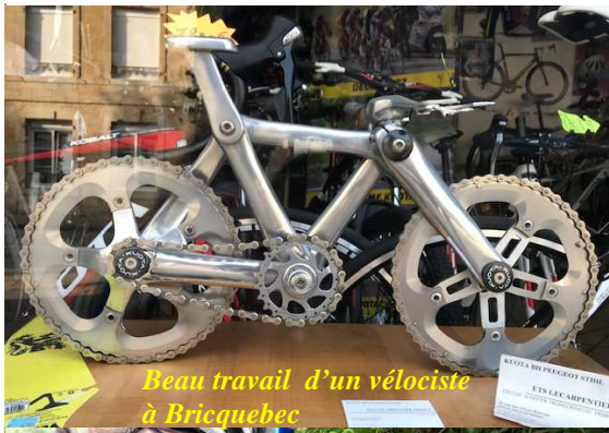
Beau travail d'un vélociste à Bricquebec