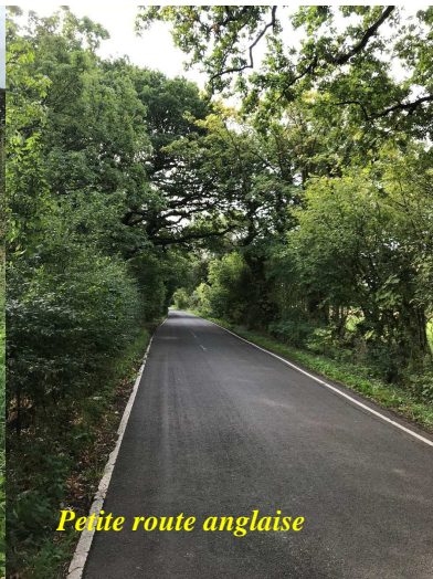
Petite route anglaise