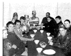
Au hasard des tables

La première sortie d'entraînement des coureurs de l'ESL s'est achevée à la salle des fêtes. Comme le veut la tradition, tous les participants ont dégusté la brioche des rois et le chocolat chaud.