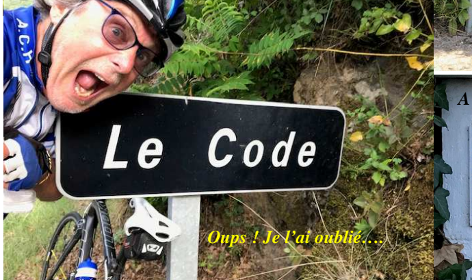
Oups ! Je l'ai oublié...