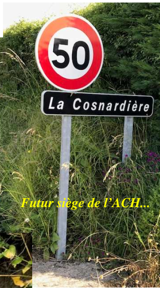
Futur siège de l'ACH...