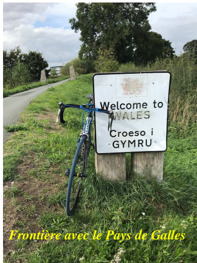
Frontière avec le Pays de Galles

temps, heureusement, les Anglais semblent respectueux des cyclistes et restent sagement derrière, sans klaxonner et doublent avec prudence. De rares bandes cyclables et j'ai pu profiter du « Wirral way », une voie verte assez longue qui fait le tour de la péninsule. Mais le problème, c'est que c'est une piste du genre des voies vertes de la Manche : un sentier en terre, pas vraiment roulant, sous les arbres, donc avec pas mal de branches, et surtout beaucoup de piétons avec des chiens (ils aiment bien les animaux par ici, mais ne sont guère attentifs à ce qu'ils font, accrochés qu'ils sont à leur téléphone). Et, particularité locale, de nombreuses barrières qu'il faut ouvrir et surtout refermer, si vous ne voulez pas avoir d'ennuis.