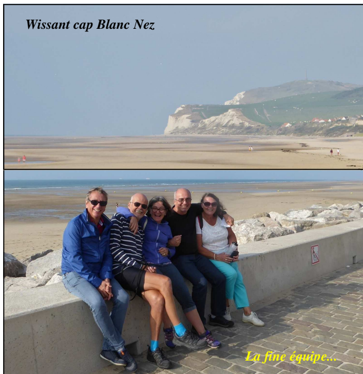
La fine équipe...

Cap Blanc Nez en toute fin d'après-midi où le soleil fait grise mine. Allez, on rentre. Demain est un autre jour.