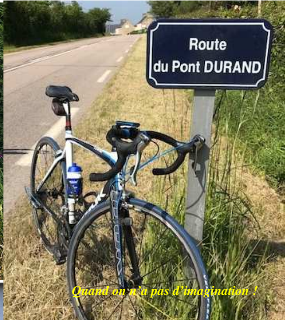
Quand on n'a pas d'imagination !