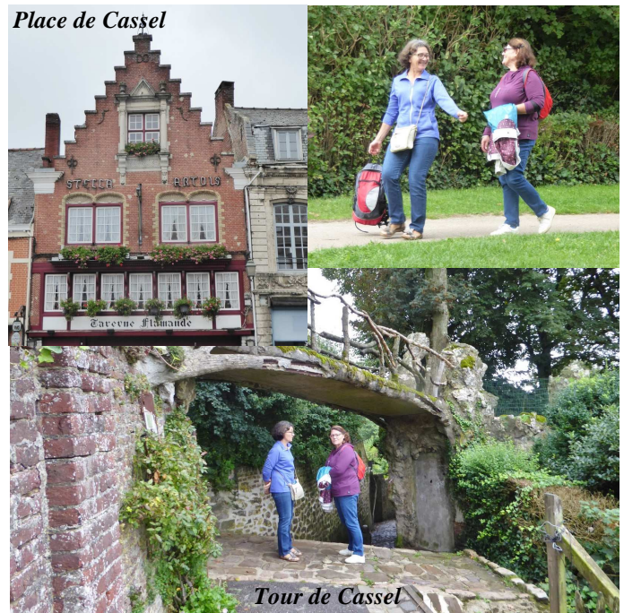
Tour de Cassel