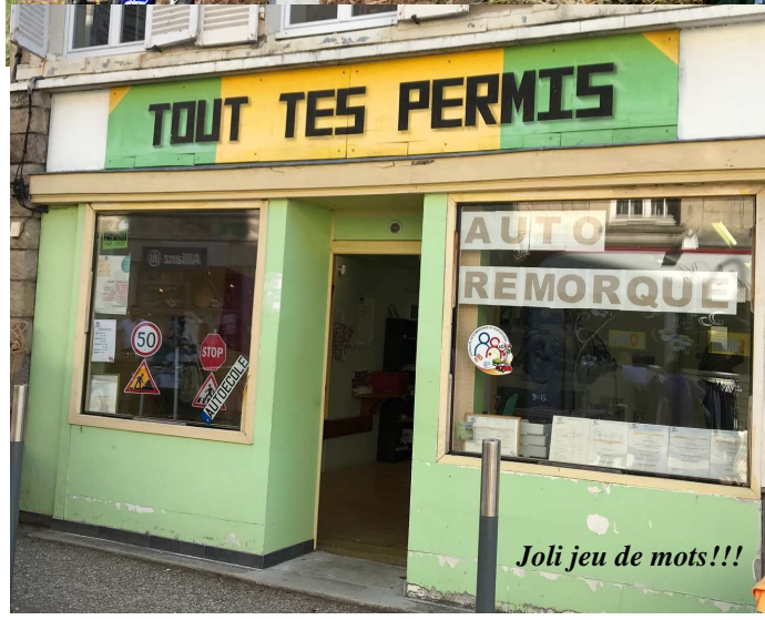
Joli jeu de mots!!!