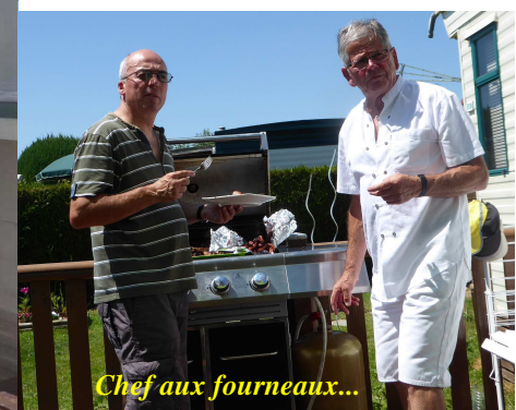
Chef aux fourneaux...