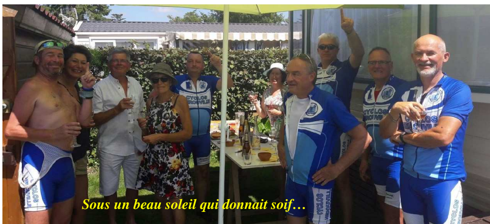
Sous un beau soleil qui donnait soif...