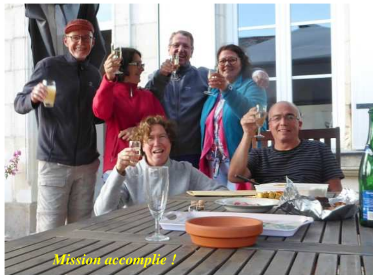
Mission accomplie !