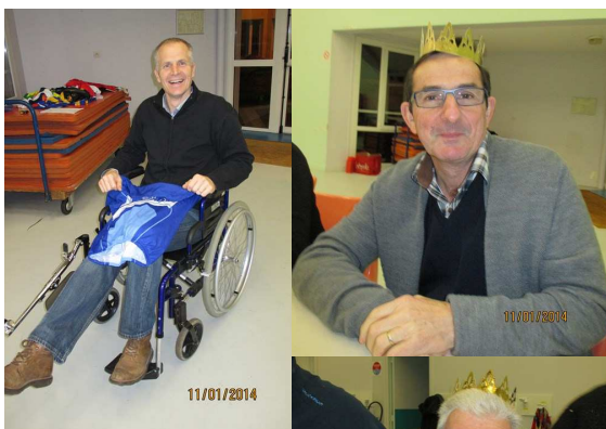
Rois et reines d'un soir