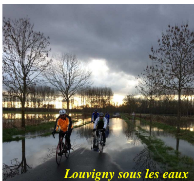
Louvigny sous les eaux