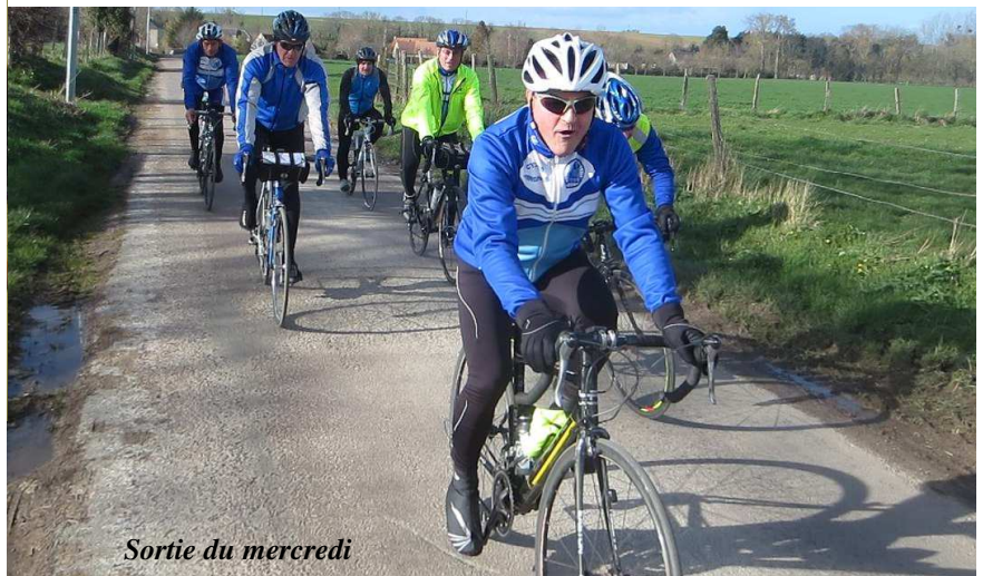
Sortie du mercredi